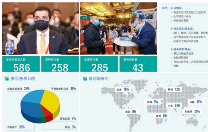
300+ Best Buyers from 专业买家来自：

中国石油化工装备峰会暨展览会 (CSSOPE) 先后得到了商务部、工信部、中国机械工业联合会、中国通用机械工业协会、中国阀门协会、江苏省石化装备行业协会、中国国际商会山东商会石油装备经贸分会、盘锦经济开发区管理委员会、中国城市燃气协会 LNG 分会、挪威国家石油商会、美国供应管理协会、缅甸油气服务协会、中国物流与采购联合会、中国机电产品进出口商会等政府机构及行业协会的鼎力支持。先后在北京和上海两地举办，期间举办“缅甸采购专场”，“乌兹别克斯坦采购专场”，“中东采购专场”，“埃及采购专场”等独立会议。