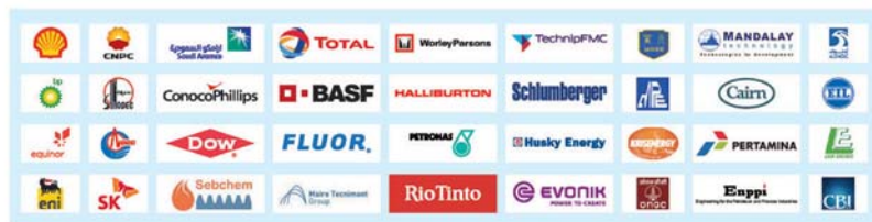
300+ Best Suppliers from 优秀展商来自：